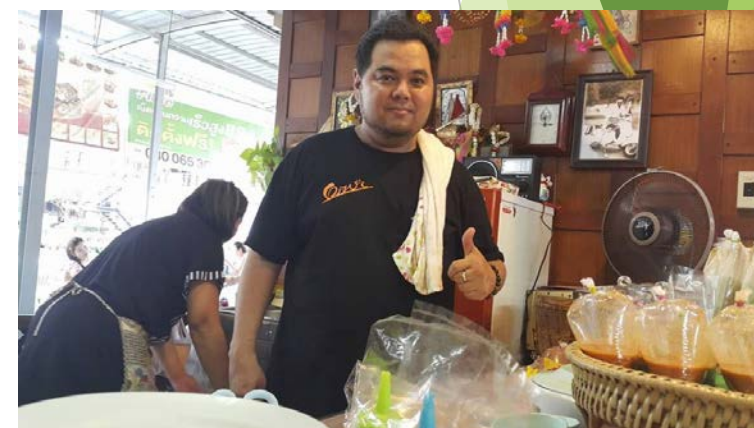
แฟรนไชส์ หมูสะเต๊ะ บางซื่อ