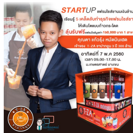
แฟรนไชส์ T-za ชาปากยูน