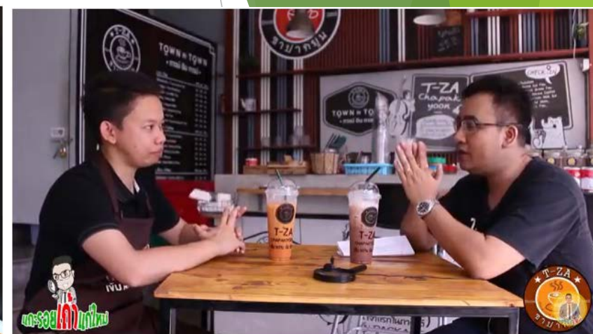
แกะรอยเจ้าแก้มใหม่ตอน แกะรอย 3 ปี 300 ล้าน ชา T Za ชาปากยูง #3