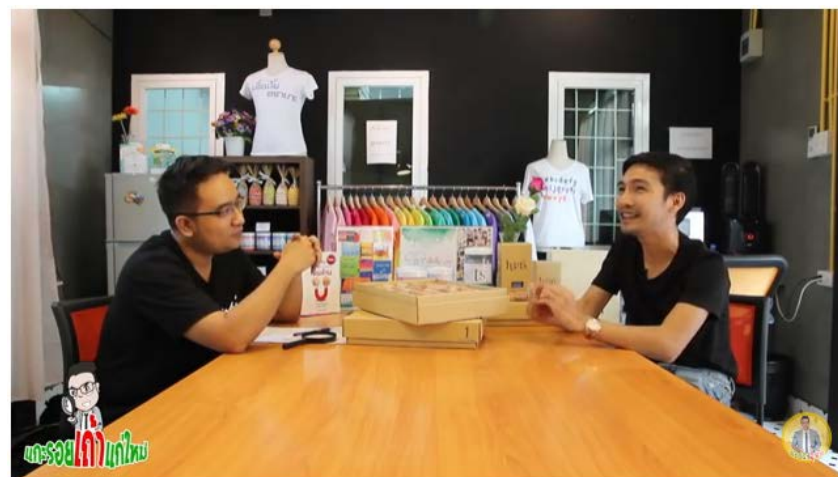
แกะรอยเจ้าแก้มใหม่ ตอน เสื้อบั้งเก๋ ๆ ร้อยล้าน