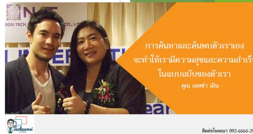
แฟรนไชส์ NST วิเคราะห์ลายนิ้วมือ