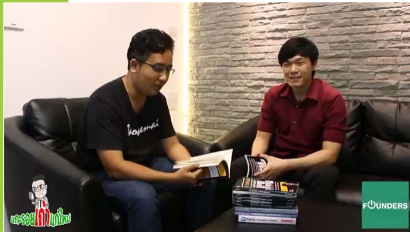
แกะรอย คุณเชิร The Founders มีอาชีพ Content Marketing #1