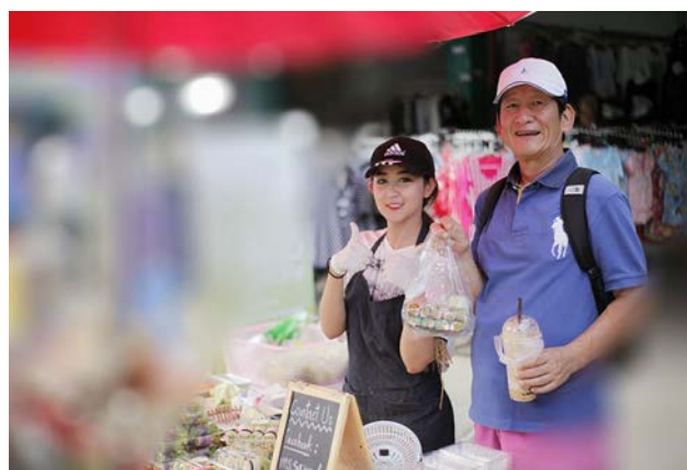
แฟรนไชส์ สลัด Miss Sarada