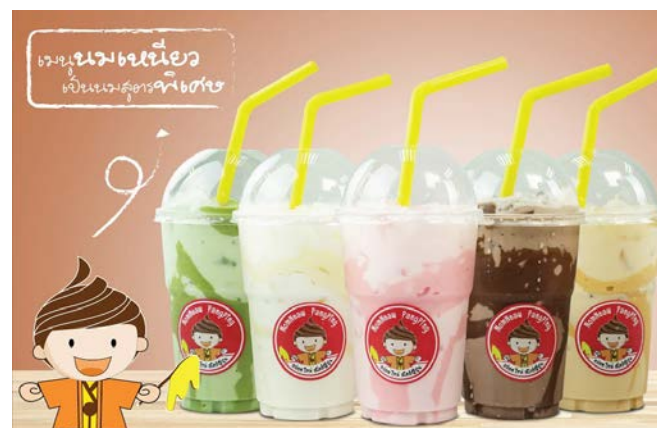
แฟรนไชส์ นมเหนียว ปังปัง