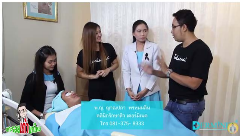
แฟรนไชส์สถานเสริมความงาม Derminet