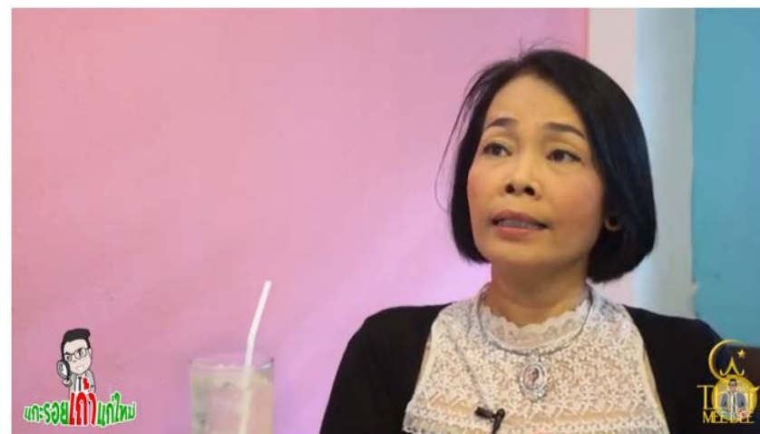
แกะรอยเจ้าแก้มใหม่ : ตอน กว๋ยเตี๋ยวสุโขทัยฮาลาล #2